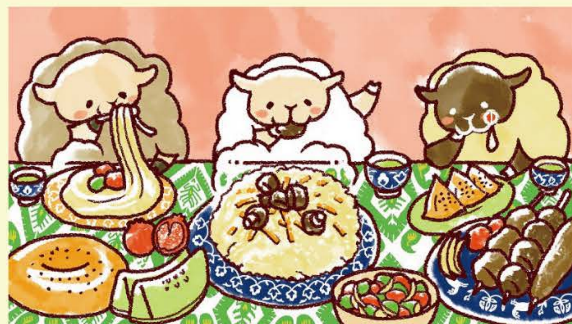
▲ 「おいしい中央アジア協会」イメージイラスト・キャラクターデザイン