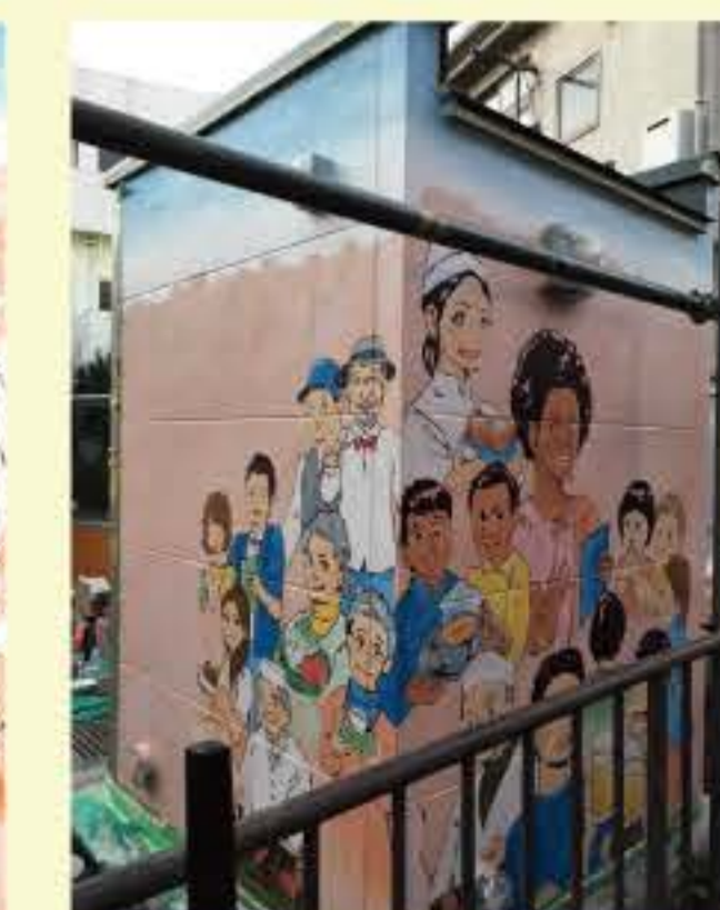
▲ 豊島区「アートトレプロジェクト」イラスト提供