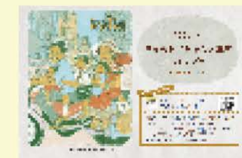
▼ 2013年より毎年作っている「世界のおじちゃん」カレンダー