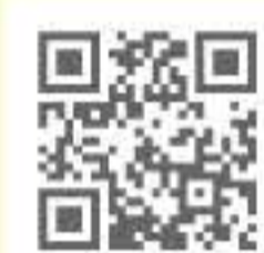
「女一匹シベリア鉄道の旅」