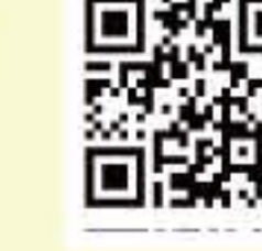
「世界家庭料理の旅おかわり」