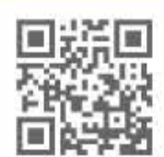
「北欧! 自由気ままに子連れ旅」