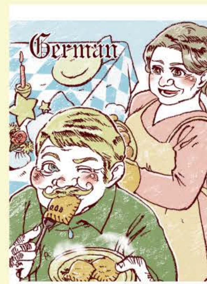
◀ 「世界のおじちゃん」つまみぐいをするハインツ

大好評の「世界のおじちゃん」シリーズ他、各国料理やキャラクターデザイン、公共施設のアートなど、幅広く活躍しています。