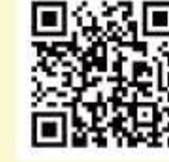
「世界家庭料理の旅」