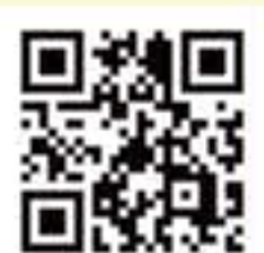
「世界を旅する母ちゃん駒込で子育て」