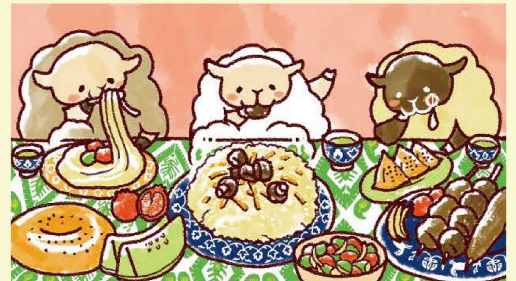
▲ 「おいしい中央アジア協会」イメージイラスト・キャラクターデザイン