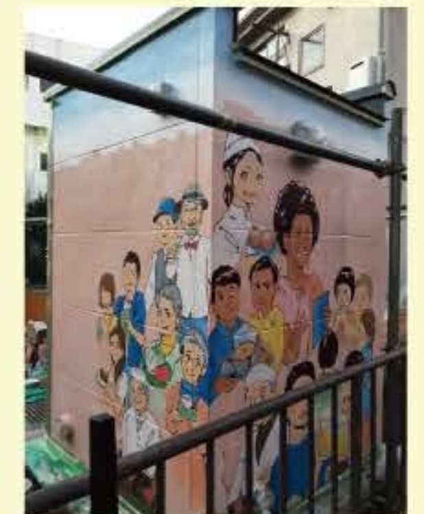
▲ 豊島区「アートトレプロジェクト」イラスト提供